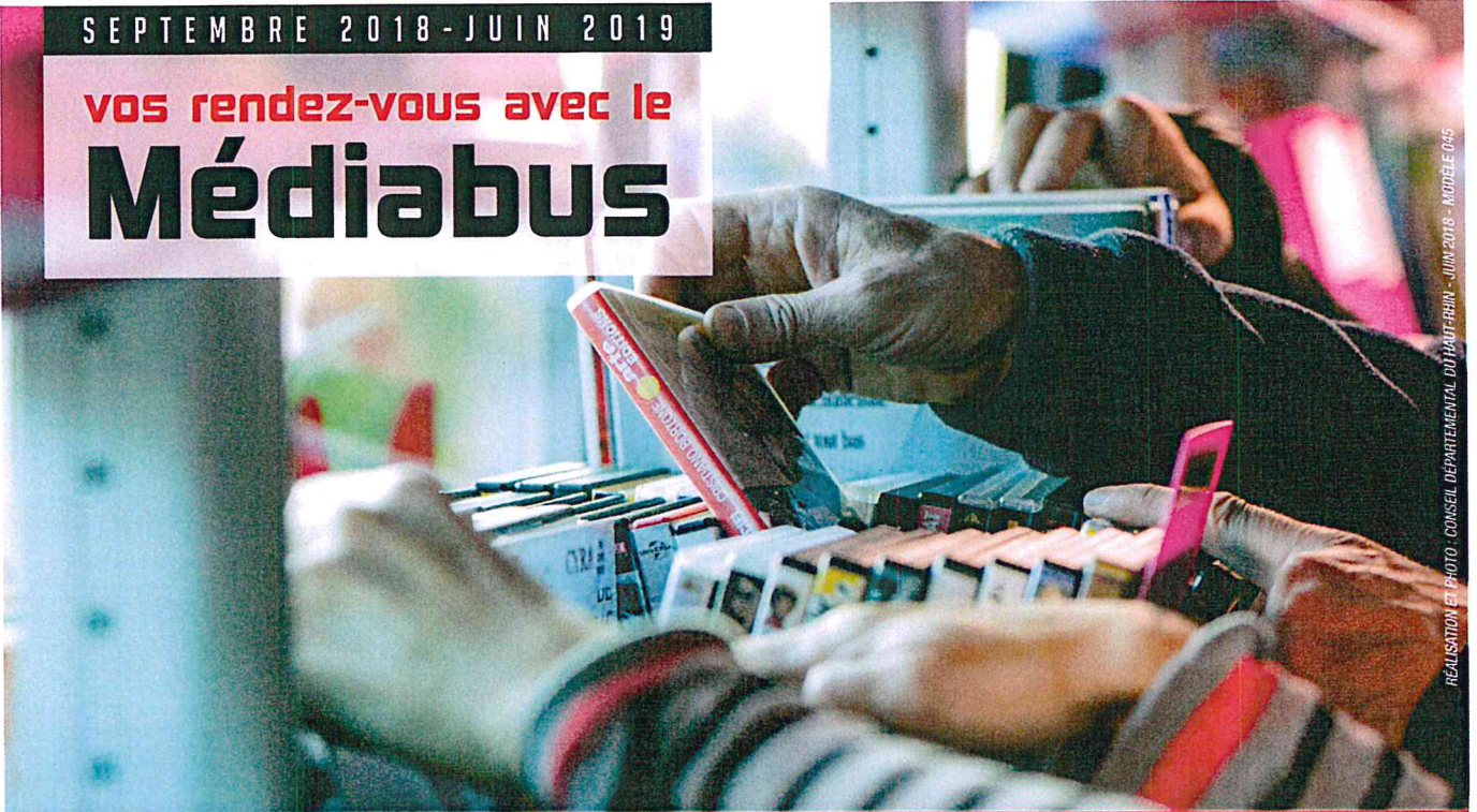
REALISATION ET PHOTO : CONSEIL DÉPARTEMENTAL DU HAUT-RHIN - JUIN 2018 - MODELE 045

PLUS DE 3 000 DOCUMENTS DISPONIBLES GRATUITEMENT PRÈS DE CHEZ VOUS !